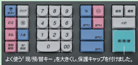
よく使う「現/預/替キー」を大きくし、保護キャップを付けました。

使用頻度の高いキーが大きく、誤操作を抑えます。金額入力、分類キー、売上キーをブロックごとに配列。忙しい時間帯でもレジ操作が迅速にできます。